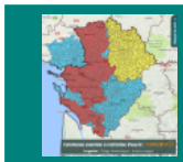
Restrictions pour l'usage agricole au 12/01/17

Pour suivre, à l'échelle de la commune, les restrictions et l'état des nappes et des rivières, rendez-vous sur le site Info Eau : http://info.eau-poitou-charentes.org/ .