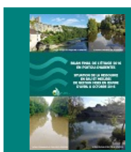
Bilan Final Etiage 2016 Poitou-Charentes

Enfin, le document indique quelles ont été les mesures de restriction des usages mises en œuvre durant la période d'étiage , en abordant également les éventuels impacts sur l'alimentation en eau potable des populations, et sur certaines activités économiques, le cas échéant.