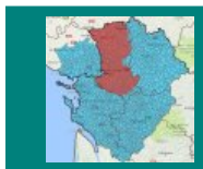
Restrictions au 9 décembre 2016

Pour suivre, à l'échelle de la commune, les restrictions et l'état des nappes et des rivières, rendez-vous sur le site Info Eau : http://info.eau-poitou-charentes.org/ .